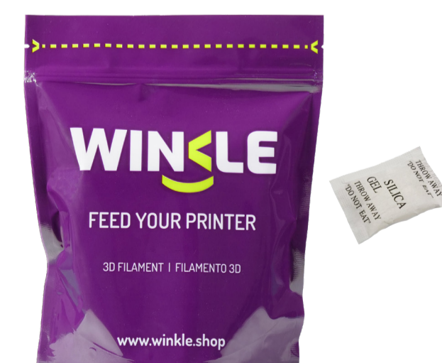
Bolsa reutilizable, bobina y sílice